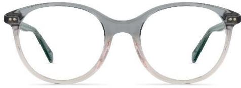
A11 462 col. 79 PVC: 369,- Euro Couleur: misty rose