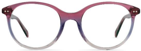
A11 462 col. 81 PVC: 369,- Euro Couleur: evening glow