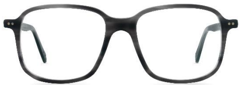
A11 460 col. 76m PVC: 369,- Euro Couleur: vintage blue gradient