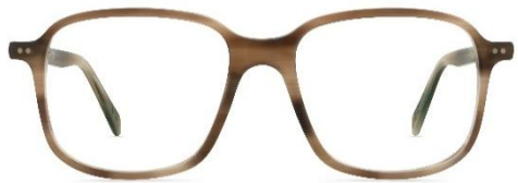
A11 460 col. 77m PVC: 369,- Euro Couleur: earthy brown melange matte