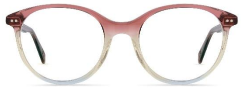
A11 462 col. 80 PVC: 369,- Euro Couleur: sundriff