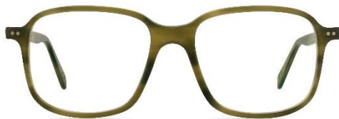
A11 460 col. 78m PVC: 369,- Euro Couleur: olive green melange matte