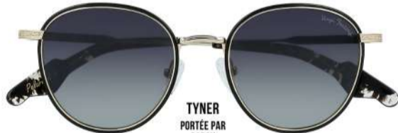
TYNER PORTÉE PAR GAROU

De loin, cette solaire TYNER est une petite bombe rétro... et plus vous vous approchez, plus vous réalisez vous avez une très bonne vue de loin... structure combinée d'inox ciselé et d'acétate, verres polarisés, charnière monobloc... Ses concurrentes peuvent se mettre aux abris !