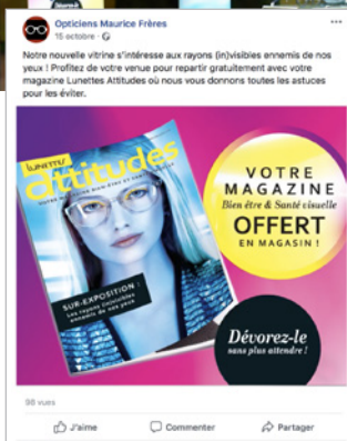
Publications sur les réseaux sociaux

Accompagné de ses supports de communication connexes, LUZ propose à ses adhérents une campagne de communication puissante et sur tous les canaux on et offline : théatralisation vitrines, marketing direct, vidéo, animation des réseaux sociaux... des outils clés en main ou réalisés sur-mesure par l'agence de communication partenaire de LUZ et dédiée à ses adhérents.