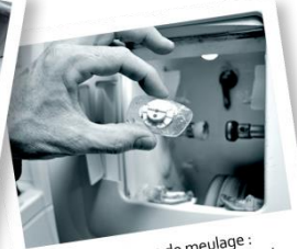
Fin de l'étape de meulage : le verre est parfaitement découpé.