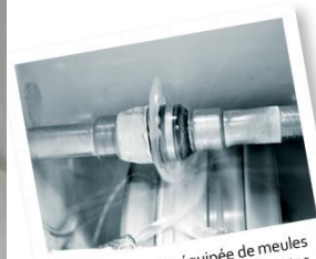
La meuleuse est équipée de meules diamantées permettant différentes étapes de détourage du verre.

Vous pensez que les créations des « Vitrines by LUZ » tombent du ciel ? Bien sûr que non, il nous faut avoir l'œil 😊 ! Ci-contre la pige de cette vitrine