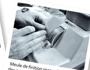
Meule de finition manuelle pour faire des contre-biseaux, c'est-à-dire casser les arêtes et éviter tout éclat.